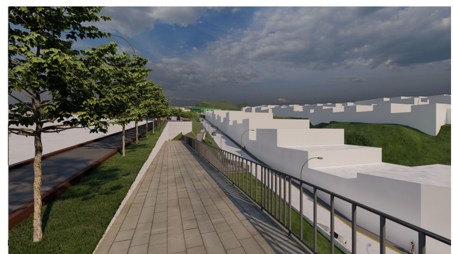
RAMPA - TRATAMIENTO PAISAJÍSTICO