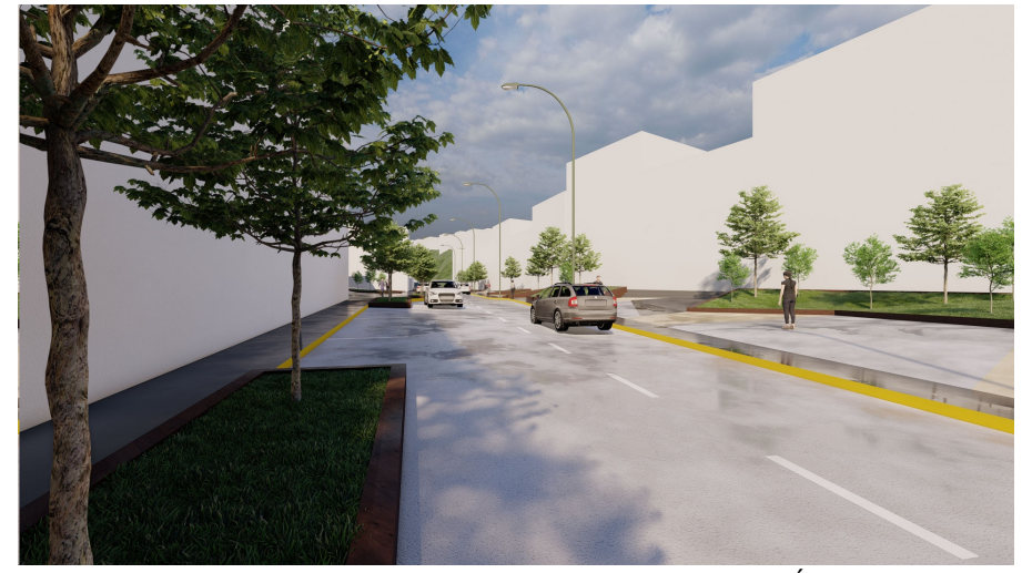
RED DE ÁREAS VERDES